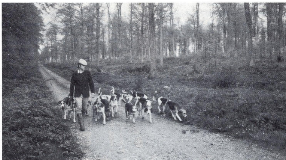
Promenade des chiens en forêt de Senonches.